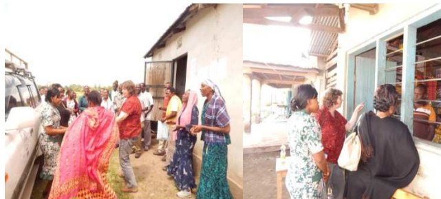
Mtathimini kutoka Ujerumani akikaribishwa kwa furaha na kikundi cha vijana Wilaya ya Siha na kulia akikagua duka la Mjasiriamali aliyepata mafunzo toka TUSONGE

Pia wataweza kupata fursa ya kutembelea siku za maazimisho ya kibiashara kama vile siku ya wakulima nane nane, siku ya sabasaba na maonyesho mengine. Hii itatumika kama fursa ya wajasiriamali kujifunza mbinu za biashara hususani kuongeza thamani ya bidhaa. Sambamba na hayo wajasiriamali watapata fursa ya kupata ruzuku kutoka serikalini pamoja na kupanua wigo wa kuisaidia jamii kwa mapana zaidi. Kama vile kusaidia yatima na watu wanaoishi na ulemavu